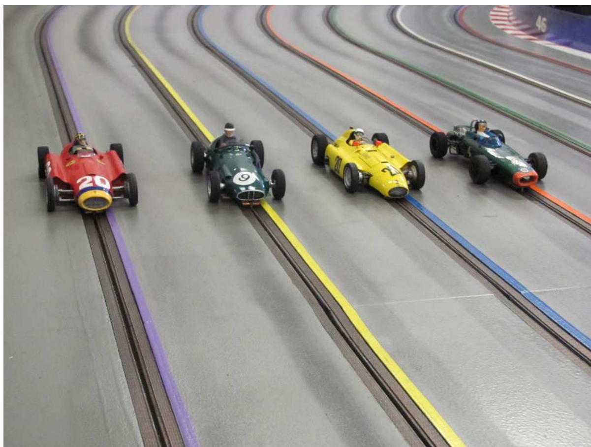
Monoposty GP do r. 1965 (1. místo, 2., 3. a 4., zleva)